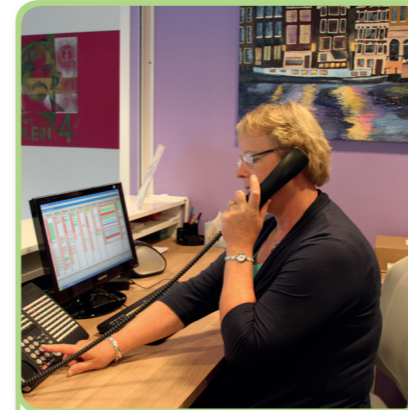
1. de doktersassistente