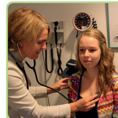
5. de stethoscoop