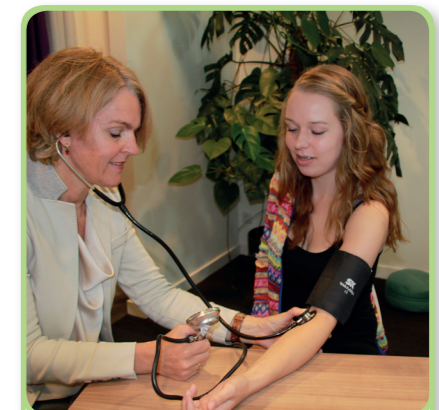
6. de bloeddrukmeter