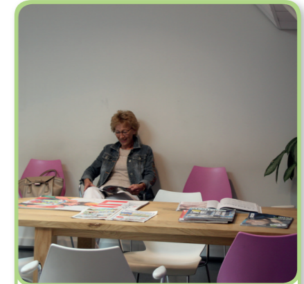
3. de wachtkamer