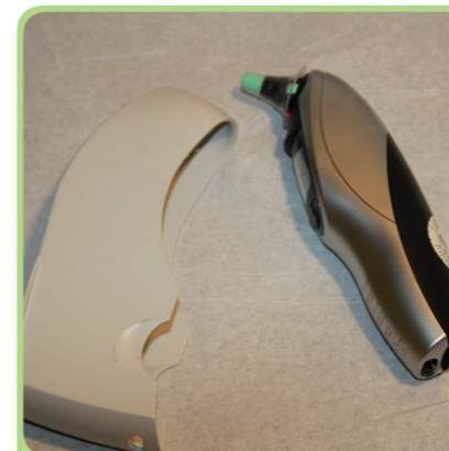
4. de oorthermometer