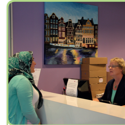
2. de balie