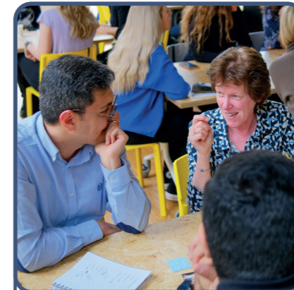
2. het netwerk