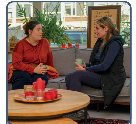
3. de vriend