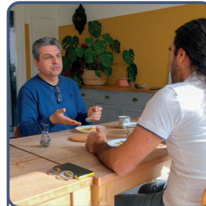
1. het contact

Woorden: zeg na, schrijf over en maak een zin.