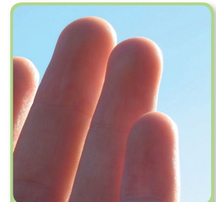
6. de vingertoppen