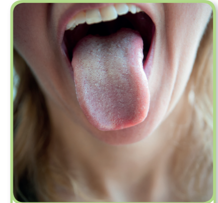
3. de tong