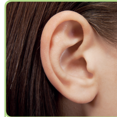
1. het oor

Woorden: zeg na, schrijf over en maak een zin.