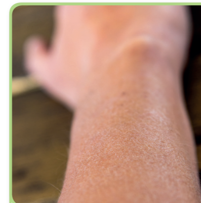
5. de huid