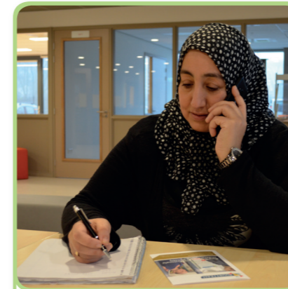
1. de administratie