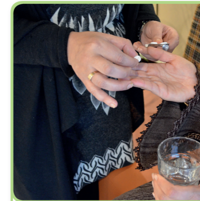
2. het medicijn geven